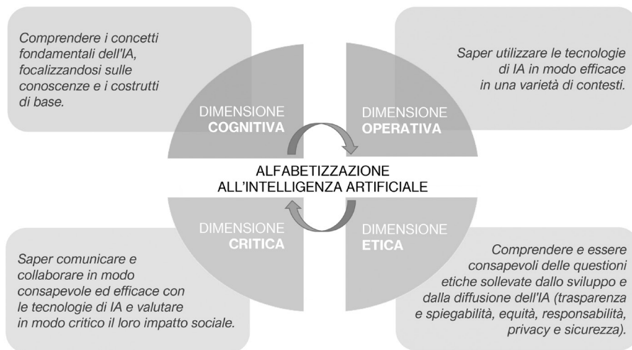
Figura 1 - Il framework per l'alfabetizzazione critica all'IA di M. Ranieri e colleghi

Adattato da: RANIERI - CUOMO - BIAGINI, Scuola e intelligenza artificiale 21.